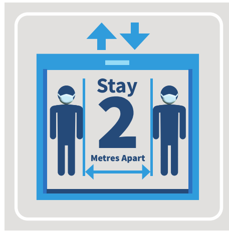
مهودای دوو مهتر له گهڵ ئهو انیتر به جیبهیله